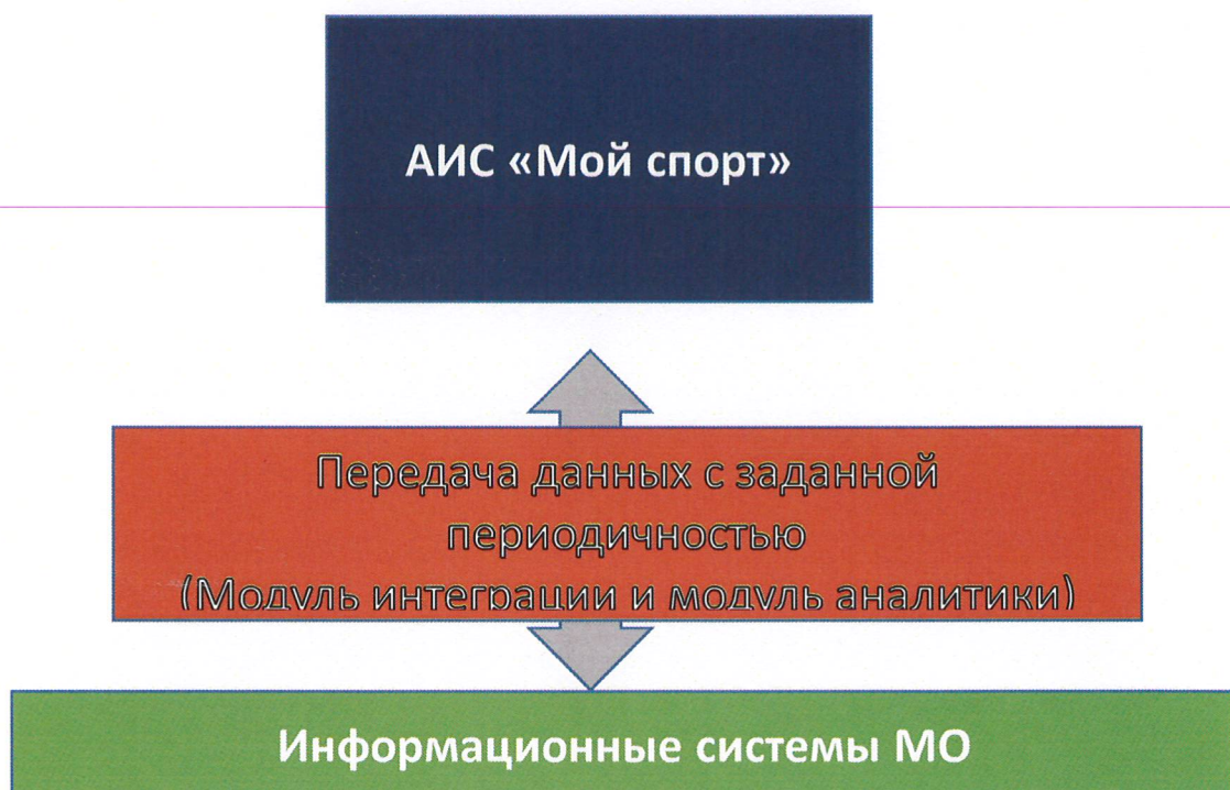
Рисунок 1 – Схема интеграции между АИС «Мой спорт» и Модуля интеграции

Схема передачи данных из АИС «Мой спорт» в информационные системы МО представлена на рисунке 1.